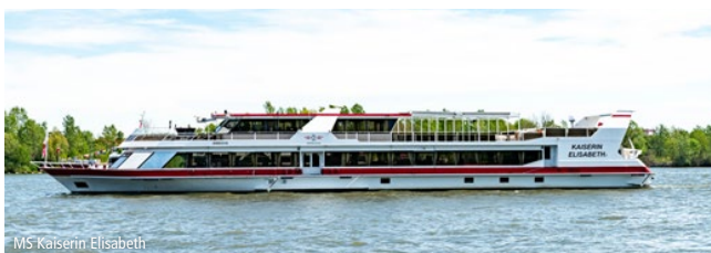
MS Kaiserin Elisabeth