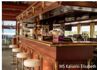
MS Kaiserin Elisabeth