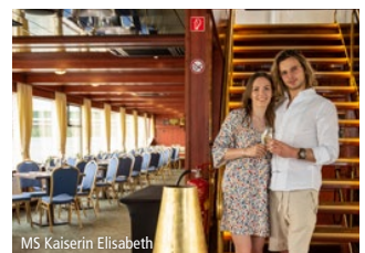
MS Kaiserin Elisabeth