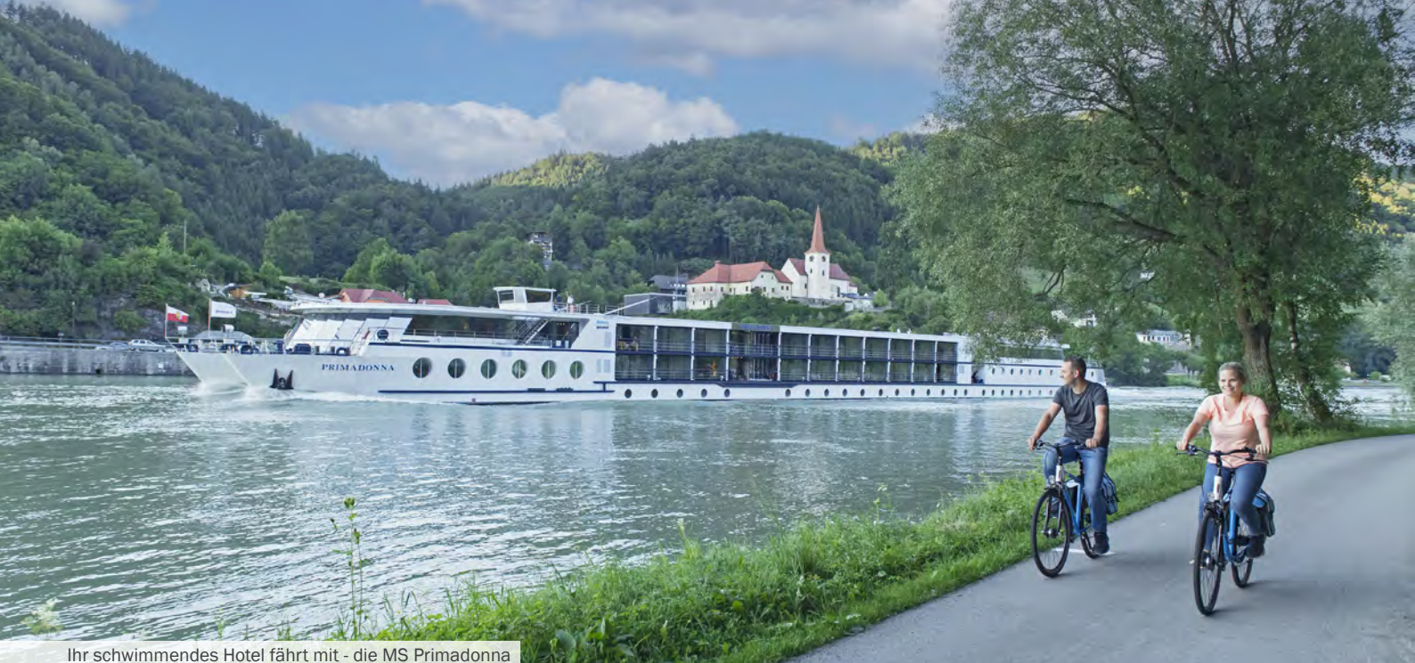
Ihr schwimmendes Hotel fährt mit - die MS Primadonna

Die schönsten Abschnitte des Europa-Radweges E6 erfahren Sie bei diesem aktiven Urlaub an der Donau ohne besondere Anstrengung! Die Wachau, das Donauknien, der Nationalpark Donau-Auen oder die autofreien Radwege durch Wien und Budapest gehören zu den schönsten Erlebnissen dieser Radkreuzfahrt. Genießen Sie den Komfort eines schwimmenden 1 st -Class-Hotels.