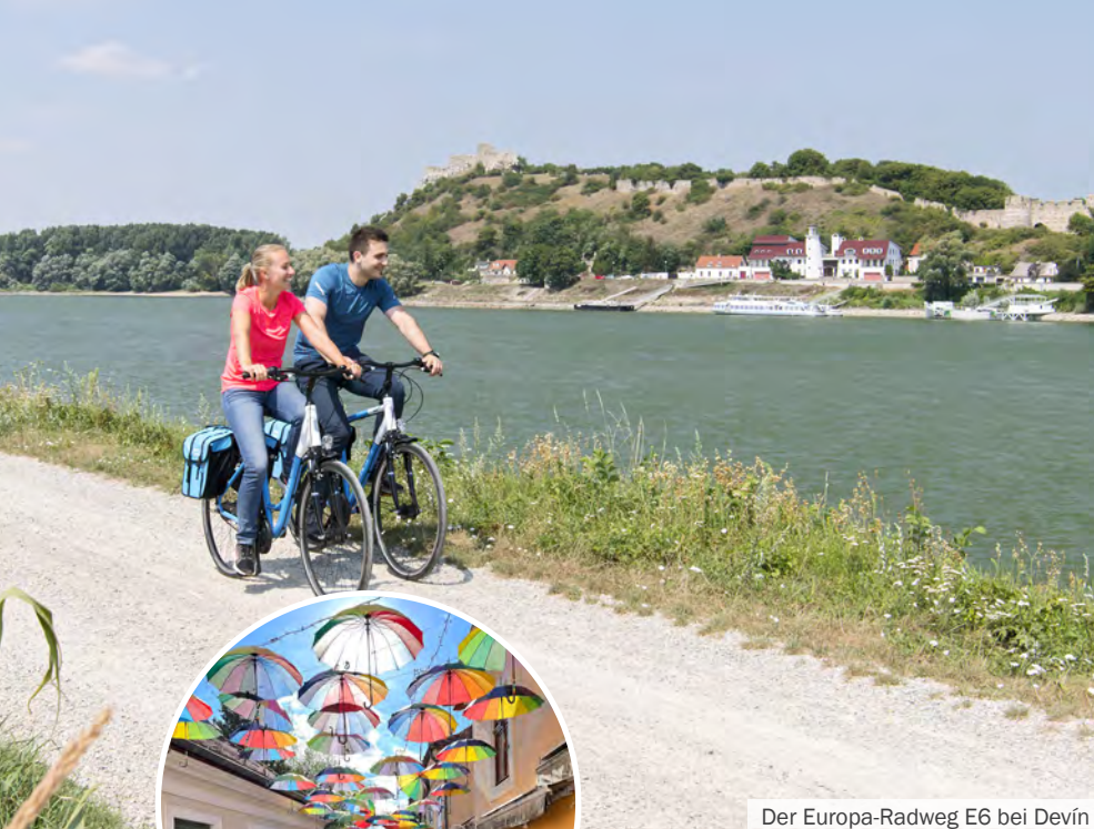
Der Europa-Radweg E6 bei Devín