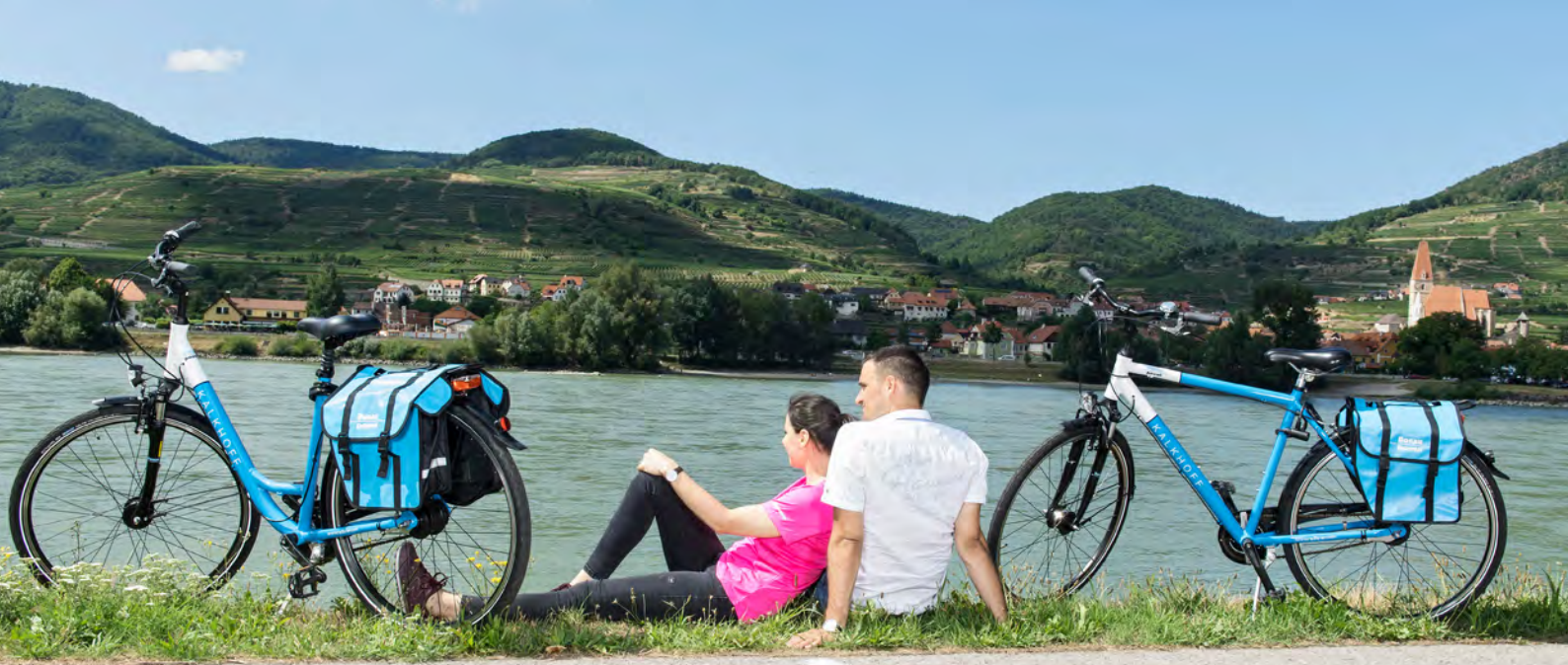
Ebener Donau-Radweg bei Spitz

Der Donau-Radweg Passau - Wien gilt als Vater aller Radfernwege in Europa. Eben und abseits des Autoverkehrs erfahren Sie anmutige Landschaften von engem Kerbtal bis zu den Weiten des Nationalparks Donau-Auen. Klöster, Burgen, Schlösser oder barocke Städte säumen den Weg. Dies ist die richtige Urlaubsmischung. Tipps für eine gemütliche Einkehr beim Heurigen oder im typischen Wiener Kaffeehaus gibts an Bord.