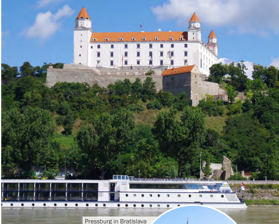
Pressburg in Bratislava