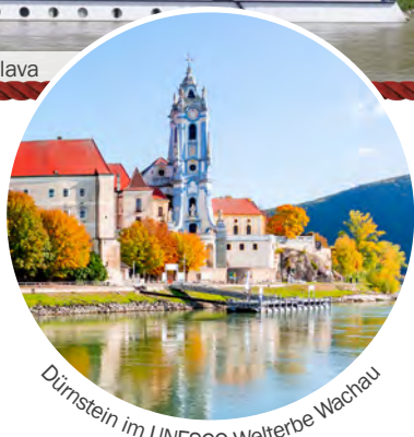
Dürnstein im UNESCO-Welterbe Wachau