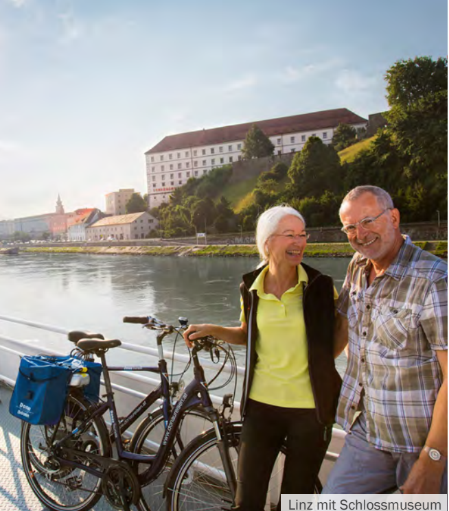
Linz mit Schlossmuseum