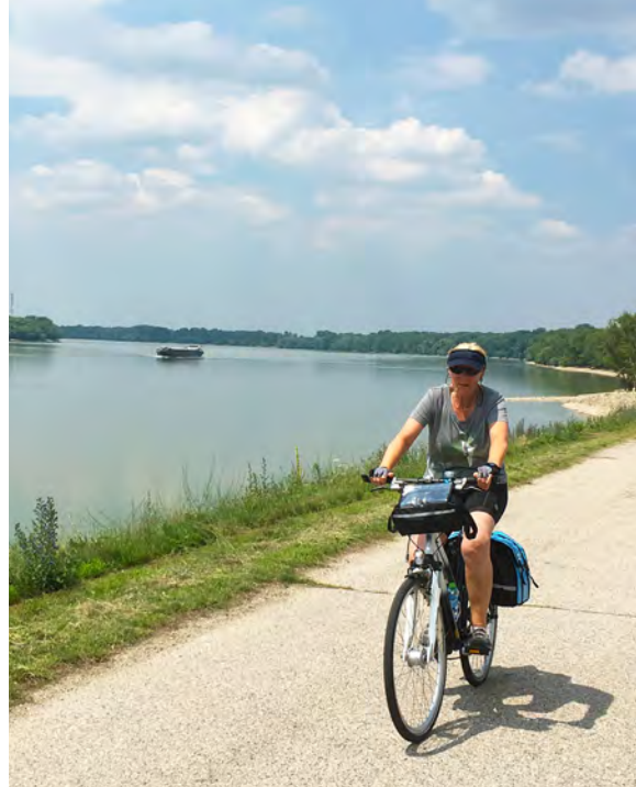
Autofreie Donau-Radwege bei dieser Radkreuzfahrt