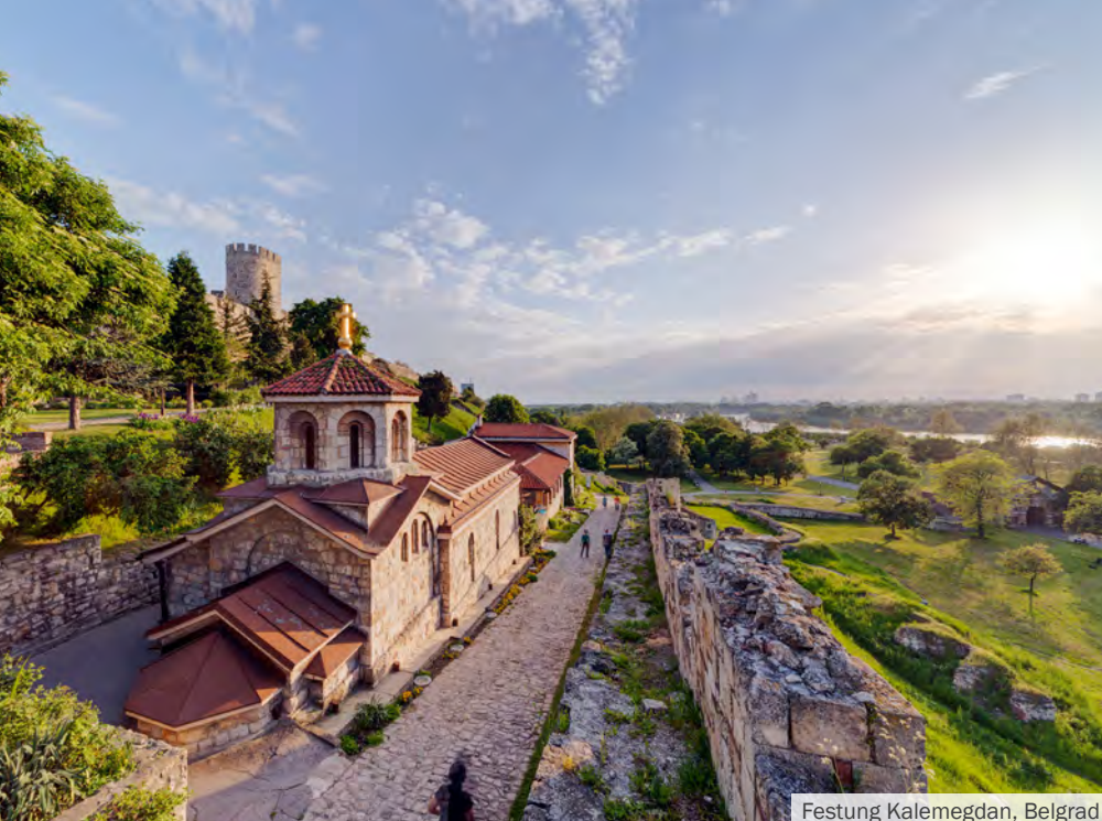
Festung Kalemegdan, Belgrad