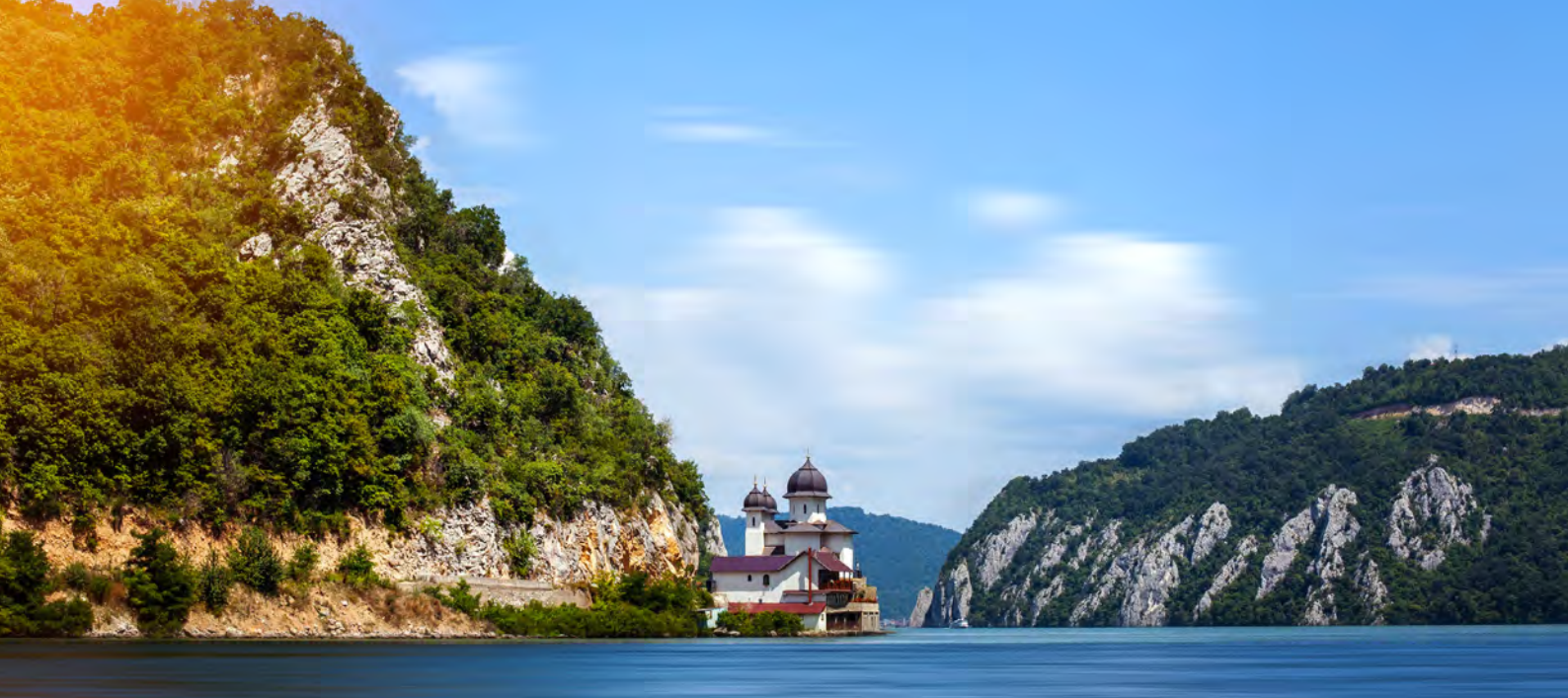
Die alte Signalstelle Mraconia im Naturpark Eisernes Tor/Rumänien

Die schönsten Abschnitte des Europa-Radweges E6 zwischen Passau und dem Eisernen Tor erleben Sie hier neben einer großartigen Schifffahrt durch die Weiten Ungarns, dem Donauknien oder dem Durchbruchstal durch die wilden Karpaten. Die Nationalparks Duna-Dráva und Kopački rit (Sumpfgebiet) sowie der Silbersee in Serbien bieten bleibende Eindrücke.