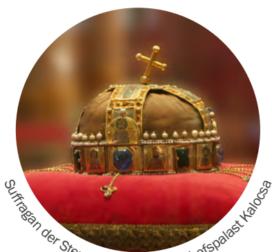
Süßfragen der Stephanskrona im Bischofspalast Kalocsa