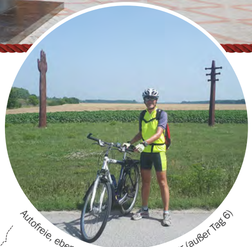
Auftouren, ebene Radwege bei dieser Tour (außer Tag 6)