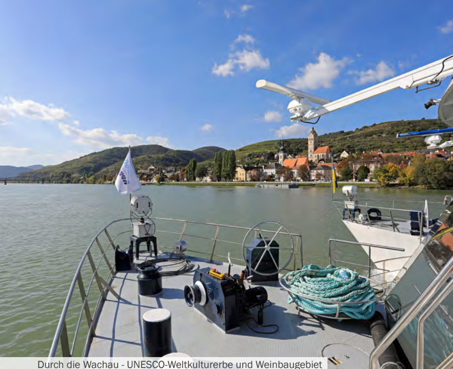
Durch die Wachau - UNESCO-Weltkulturerbe und Weinbaugebiet