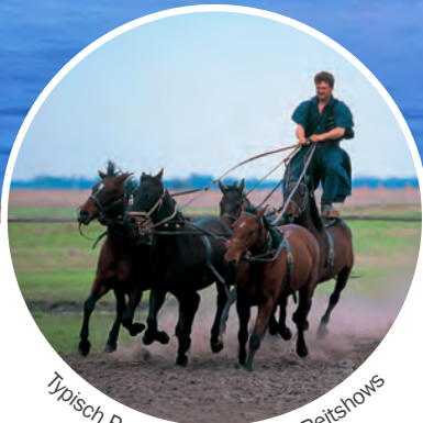
Typisch Puszta: spektakuläre Reitshows