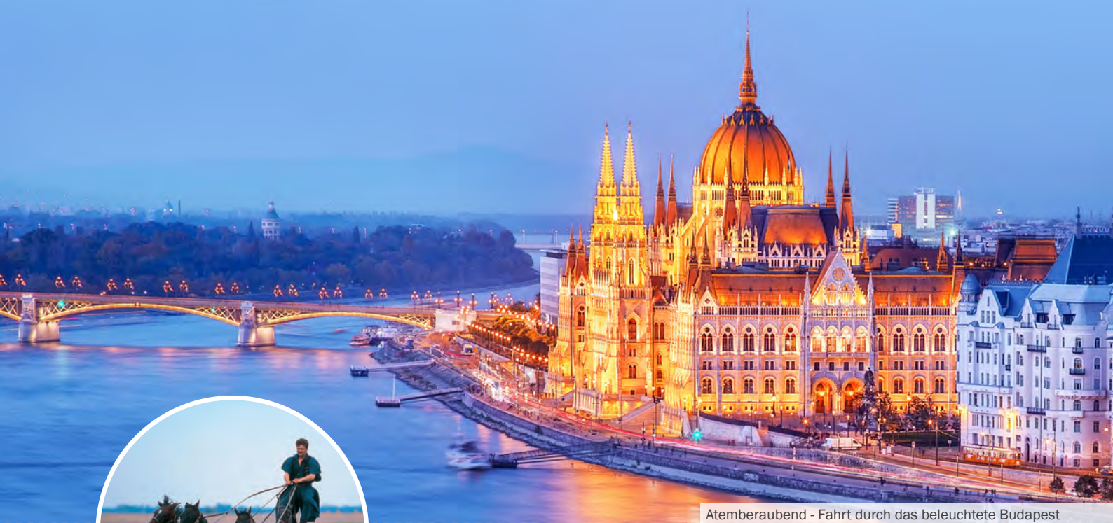
Atemberaubend - Fahrt durch das beleuchtete Budapest