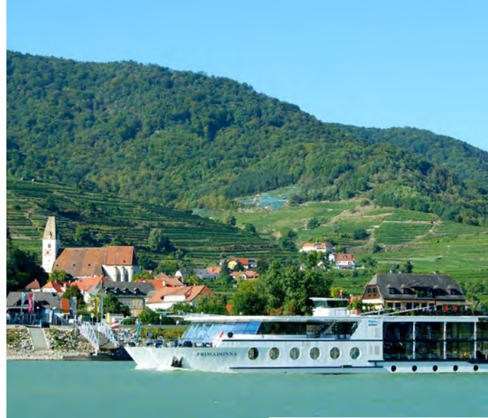
MS Primadonna bei Spitz

Raus aus der Hektik des Alltags! Lassen Sie sich vom Top-Service, den frisch an Bord gekochten Speisen und dem einzigartigen Flair begeistern. Bei dieser kurzweiligen Kreuzfahrt an Bord des 1 st -Class Schiffes MS Primadonna - das einzige Kreuzfahrtschiff unter österreichischer Flagge - erleben Sie einen einzigartigen Kurzurlaub.