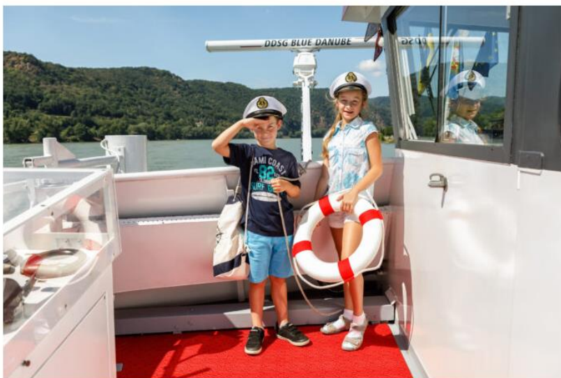
So eine Schifffahrt die ist lustig

Die Schule hat wieder begonnen und sie startet mit einer besonderen Aktion der DDSG. Die ganze erste Schulwoche dürfen Schüler sowie (Groß-)Eltern vergünstigt an Bord der DDSG Blue Danube kommen.