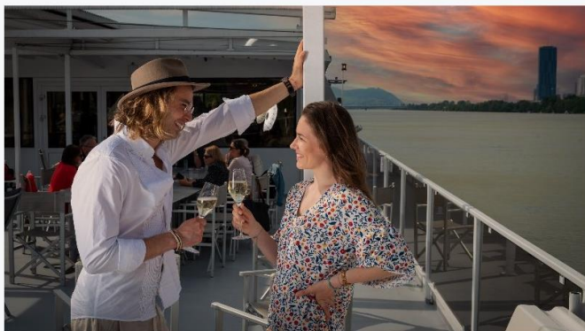
Themenabende an Bord der MS Kaiserin Elisabeth

„Glücksmomente am Schiff“ – unter diesem Motto legt die aus sieben modernen Schiffen bestehende DDSG Blue Danube-Flotte zu unzähligen Schifffahrten am Tag und am Abend ab. Egal ob eine gemütliche Schifffahrt durch das UNESCO-Weltkulturerbe Wachau, eine Sightseeing Cruise am Wiener Donaukanal oder eine Themenfahrt mit jeder Menge Unterhaltung und kulinarischer Vielfalt – an Bord der DDSG Blue Danube stehen Entspannung, Erholung und Erlebnis im Vordergrund.