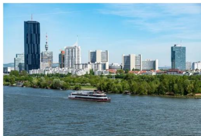
Bei den sommerlichen Themenfahrten der DDSG Blue Danube locken abwechslungsreiche Attraktionen und kulinarische Angebote.

„Glücksmomente am Schiff“ – unter diesem Motto legt die aus sieben modernen Schiffen bestehende DDSG Blue Danube-Flotte zu unzähligen Schifffahrten am Tag und am Abend ab. Egal ob eine gemütliche Schifffahrt durch das UNESCO-Weltkulturerbe Wachau, eine Sightseeing Cruise am Wiener Donaukanal oder eine Themenfahrt mit jeder Menge Unterhaltung und kulinarischer Vielfalt – an Bord der DDSG Blue Danube stehen Entspannung, Erholung und Erlebnis im Vordergrund.