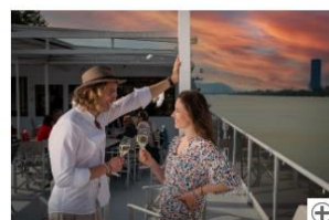
DDSG Blue Danube: Themenfahrten im Juli 2023 Download (1,08 MB)

Die MS Admiral Tegetthoff bietet im Juli 2023 eine Reihe an großartigen Themenfahrten an. Die größten ABBA-Songs und Smörgasbord, ein typisch schwedisches Buffet, gibt es am 7. Juli im Rahmen der Schwedischen Nacht mit ABBA-Hits. Am Donnerstag, den 13. Juli, lädt das Schiff zur „Griechischen Nacht“ ein. Eine griechische Live-Band rund um Olga Kessaris bringt Stimmung an Bord, während mediterrane Leckereien wie Tzatziki, Souvlaki, Keftedes, Moussaka & Co. den Gaumen verwöhnen. Pasta, Pizza & Tiramisu – einen lockeren Italo-Abend mit passender musikalischer Begleitung kann man mit der „Italienischen Nacht“ am Samstag, den 22. Juli, erleben.