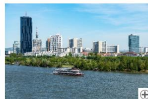
DDSG Blue Danube: Themenfahrten im Mai 2023 Download (4,28 MB)

Bei den sommerlichen Themenfahrten der DDSG Blue Danube locken abwechslungsreiche Attraktionen kombiniert mit den dazu passenden lukullischen Gaumenfreuden und der entsprechenden musikalischen Begleitung zu einem einzigartigen Abend auf sanften Donauwellen.