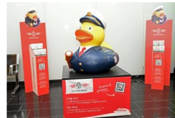
Admiral Duck am Flughafen Wien (Foto: DDSG).

Im Gegenzug wird die Flughafen Wien AG für ihre Dienstleistungen an Bord der Schiffe der DDSG werben. „Der Flughafen Wien bietet sehr attraktive und aufmerksamkeitsstarke Werbeformen am gesamten Standort, von Werbeflächen an der Autobahn über die spektakuläre LED-Werbebrücke bei der Flughafeneinfahrt bis zu Screens und Werbeflächen in den Terminals und vieles mehr. Durch die Terminalpräsenz werden Flugreisende gleich beim Ankommen auf das attraktive Angebot der DDSG Blue Danube aufmerksam. Auch freuen wir uns, unser spannendes Besucherangebot an Bord der DDSG-Blue-Danube-Flotte sichtbar machen zu können“, so Günther Ofner, Vorstand der Flughafen Wien AG.