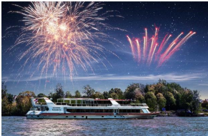
MS Kaiserin Elisabeth

Das neue Themenspecial der DDSG Blue Danube lockt mit Grill- Buffet und Live-Musik.