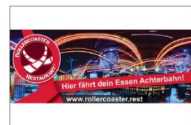
ROLLERCOASTERRESTAURANT® Vienna 1020 Wien