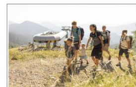
Schneeberg Sesselbahn Erlebe Natur u. Familien-Abenteuer am Schneeberg 2734 Puchberg am Schneeberg