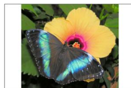
Schmetterlinghaus im Burggarten 1010 Wien