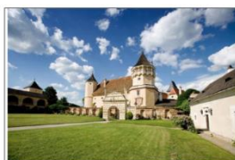
Renaissance Schloss Rosenberg 3573 Rosenberg 1