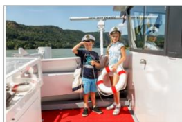
Schifffahrten mit der DDSG Blue Danube 1010 Wien