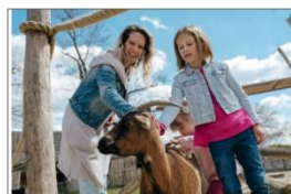
Schloss Hof inkl. Schloss Niederweiden 2294 Schloßhof