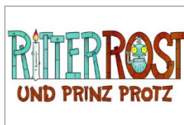
Ritter Rost und Prinz Protz 5. Juli bis 6. August 2023 3553 Schiltern