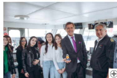
Kapitänin, Tontechnikerin oder Moderatorin sein beim Töchterttag in der Wien Holding Download (2.84 MB)

Sieben Unternehmen der Wien Holding boten im Rahmen des Töchtertags spannende Einblicke in unterschiedliche Berufsfelder: An Bord der DDSG Blue Danube gehen, einen Einblick in die Hafenlogistik gewinnen, den Museumsbetrieb im Jüdischen Museum Wien erleben, das „daily business“ am Flughafen Wien kennenlernen, Licht- und Tontechnik in der Wiener Stadthalle ausprobieren, einen TV-Beitrag beim Sender W24 erstellen oder ein Musiktheaterprojekt an der Musik und Kunst Privatuniversität der Stadt Wien entwickeln - Unternehmensführungen und praxisnahe Workshops sorgten für einen interessanten und spannenden ersten Eindruck und für die eine oder andere Alternative bei der Berufswahl!