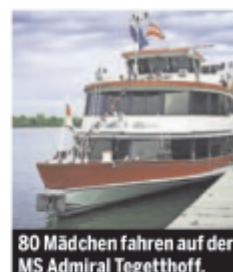
80 Mädchen fahren auf der MS Admiral Tegetthoff.