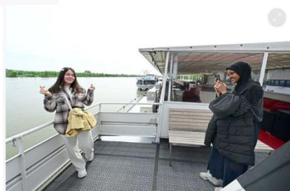
Auch das Erinnerungsfoto darf nicht fehlen.

Und nach gut einer Stunde, in der die Schülerinnen sich im Knotenknüpfen probieren konnten, vieles über die unterschiedlichen Berufe in der Binnenschifffahrt erfahren haben und auch die Kommandobrücke, Ober- und Außendeck der MS Admiral Tegetthoff genau inspizieren konnten, hieß es dann endlich: Leinen los! (Gudrun Ostermann, 27.4.2023)