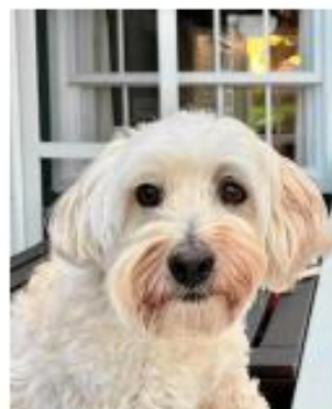
▲ Seit Mittwoch, 26. Juni, verschwunden: der Havaneser Baci floh vor dem Feuerwerk.

(sprich Batschi) schon am 26. Juni: Er ist beim Feuerwerk in Panik aus dem Garten im Strombad Kritzendorf geflohen. Suchhunde konnten die Fährte des gehüpften, beigen, neun-jährigen Hundes aufnehmen, aber nicht bis zu ihm verfolgen. Die Tierhilfe Klosterneuburg ist involviert, der Korneuburger Tierschutzverein unterstützt ebenso. „Wie kommen wir jetzt dazu, dass wir die Hunde suchen gehen?“, ärgert sich Prohaska sehr.