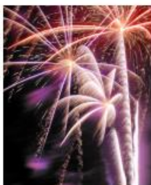
▲ Ein zertifiziertes Pyrotechnik-Unternehmen kümmert sich um die Feuer-Show am Himmel.

Für die einen ist die pyrotechnische Darstellung ein Genuss, andere haben plötzlich alle Hände voll zu tun. Die Flucht ergriff der Havaneser Baci