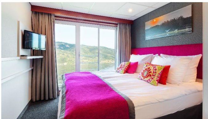
MS Nestroy, Doppelkabine Schiller- / Goethedeck