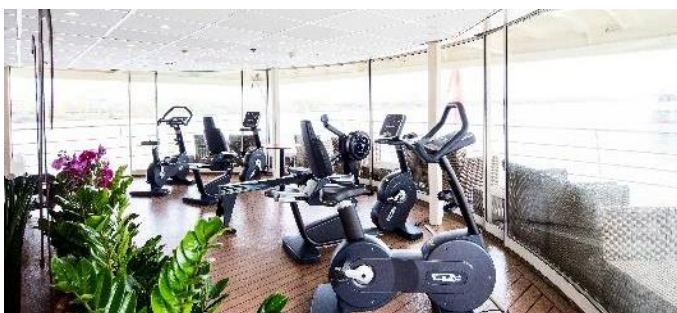
MS Nestroy, Fitnesscenter mit Panoramaaussicht