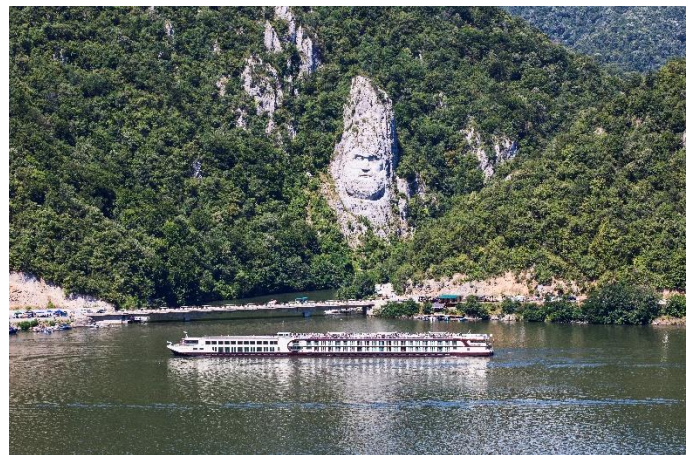
MS Nestroy mit Decebal (Eisernes Tor)