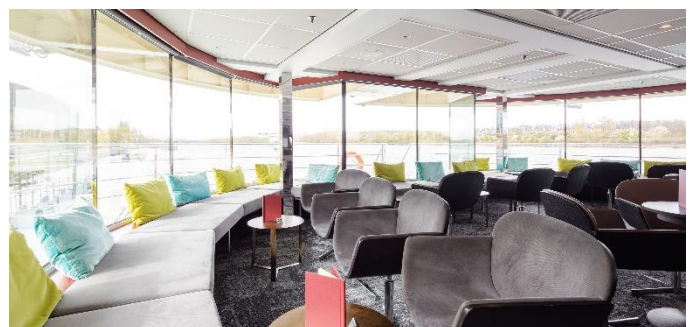
MS Nestroy, Panoramabar