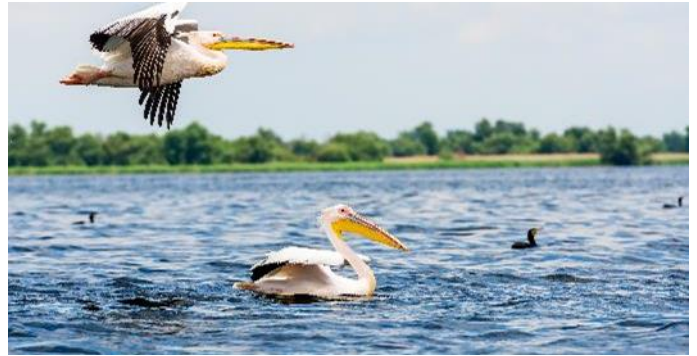
Pelikane im Donaudelta

Es ist nicht immer einfach, ein gutes Angebot als Alleinreisende/r zu finden. Daher bieten wir Ihnen jetzt NEU unser Single Special an: In der Kat. B / Grillparzerdeck nur PLUS € 300 Aufzahlung für eine Kabine zur Alleinbenutzung Limitiertes Kontingent, buchbar solange verfügbar