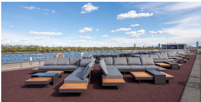
MS Nestroy, Lounge Observerdeck