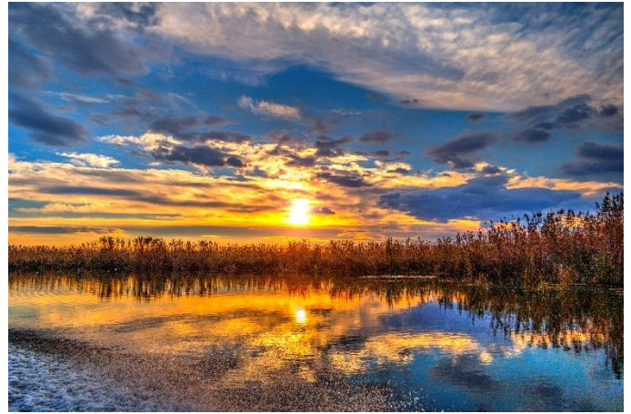
Donaudelta bei Sonnenuntergang

Morgens legen wir in Linz an und sagen nach einem letzten Frühstück an Bord der MS Nestroy Lebewohl.