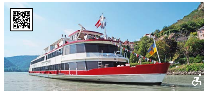
MS ADMIRAL TEGETHOFF Der Klassiker auf der Donau mit großem Sonnendeck Besonderheiten: Gediegene Atmosphäre, großzügiges, teilweise überdachtes Sonnendeck, flexibel einsetzbar