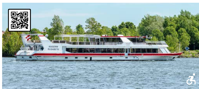
MS KAISERIN ELISABETH Die Elegante mit Panorama-Rundumsicht Besonderheiten: Freideck rundum begehbar und teilweise flexibel überdacht, Liegestühle