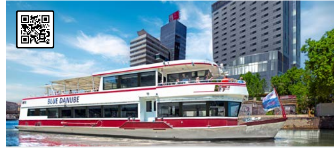
MS BLUE DANUBE Die „kleine Maritime“ im Ganzjahreseinsatz im Donaukanal und auf der Donau Besonderheiten: Besonderes Flair durch liebevolle Deko-Details, maritime Einrichtung, exklusiver Salon am Oberdeck