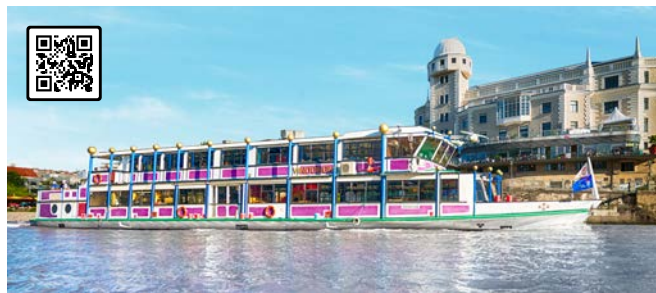
MS VINDOBONA Einen original Wiener Abend auf dem Hundertwasser-Schiff verbringen Besonderheiten: Künstlerische Gestaltung durch Friedensreich Hundertwasser, große Tanzfläche