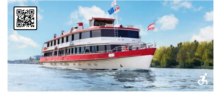
MS WACHAU Unser Schiffsklassiker im modern-maritimen Chic Besonderheiten: Schöne Bauform, großzügiges Sonnendeck, Panoramasalon