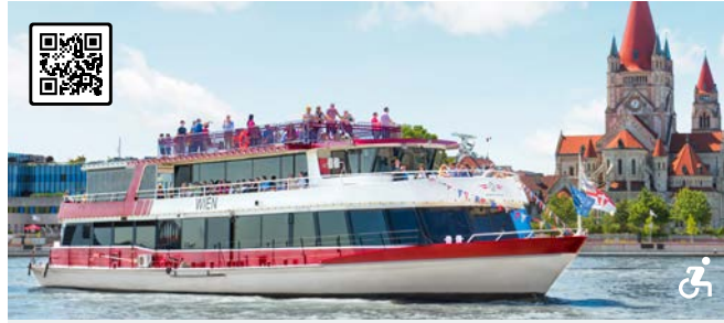
MS WIEN Mit dem Stadtschiff für Trendsetter die Wiener Szenerie kennenlernen Besonderheiten: Flexible Bestuhlung, modernes Interieur, wetterfestes Freideck