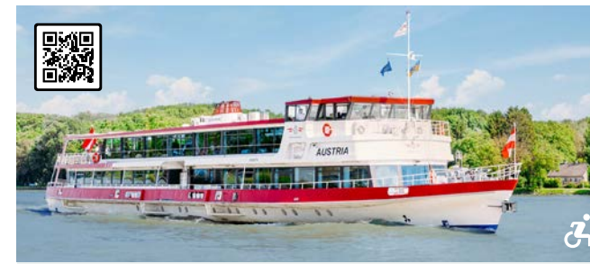
MS AUSTRIA Die Elegante der Wachau Besonderheiten: Panoramafenster, charmante Galerie, beleuchteter Wasserfall, exquisite Ausstattung