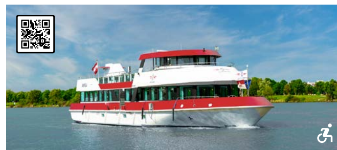
MS VIENNA Das Charterschiff mit Wow-Effekt Besonderheiten: Perfekt für Seminare, effektvolles Anrichten durch Buffetlift, Rundumblick am Freideck