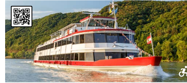
MS DÜRNSTEIN Der Stolz der Wachau im traditionellen Kalmuck-Look Besonderheiten: Authentisch nautisches Interieur passend zur Region